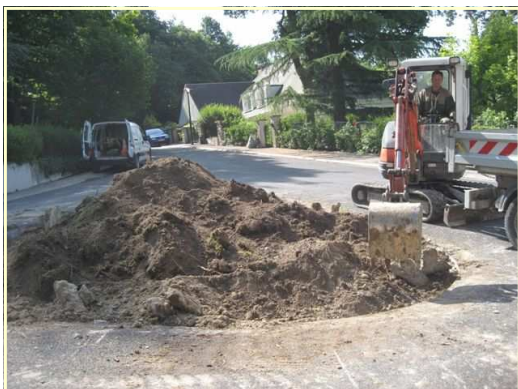
Installation d'un nouveau rond-point Allée des Pins par le personnel communal