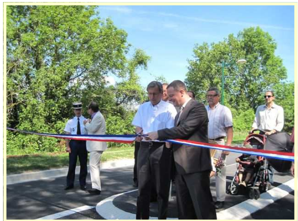
Inauguration en grande pompe de la traverse le 5 juin dernier, avec la présence du président du Conseil Général, René Paul SAVARY. Beaucoup de monde pour venir applaudir la réalisation de cette traverse et constater les finitions. Nous avons désormais une traverse digne de la route du champagne.