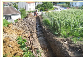
Travaux d'assainissement: pose d'une nouvelle conduite d'eau pluviale et d'eau usée (Mr VILMART rue J.Jaurès)