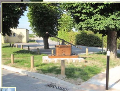
Installation de la pompe à incendie