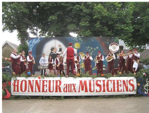
La fanfare de Champillon lors du festival intercommunal de musique à Hautvillers

Attention : cette exposition de Michèle Arsène n'est visible que le dimanche. En revanche, vous pouvez vous y rendre jusqu' au 19 septembre.