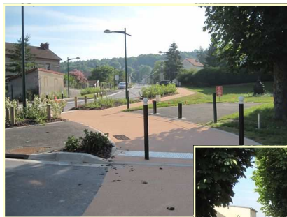
Fin des travaux rue Jean-Jaurès, pose de résine sur les trottoirs